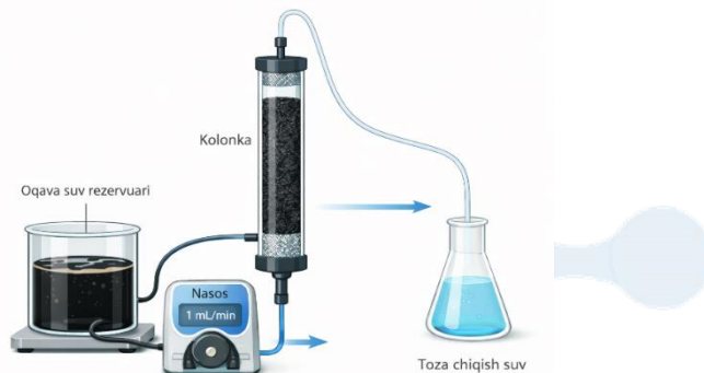
1-rasm. Dinamik sorbsiya qurilmasining sxemasi

adsorbsiyalangan modda miqdori ( C_a ), sorbsiya sig'imi ( q ) hamda sorbsiya darajasi (%) kabi asosiy parametrlar hisoblandi. Nisbiy konsentratsiya sorbent qatlamidan o'tgan eritmaning tozalash samaradorligini ifodalovchi muhim parametr bo'lib, quyidagi tenglama orqali hisoblandi: